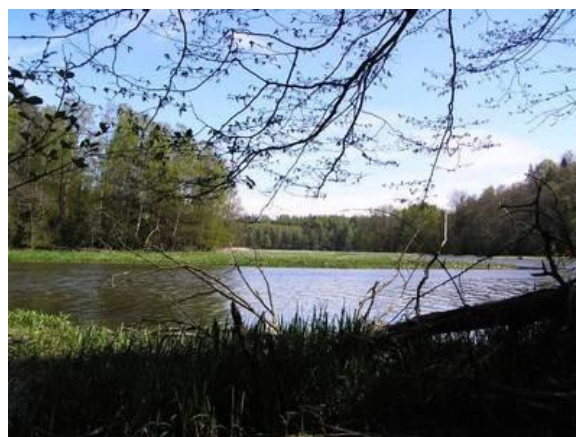
Rezerwat przyrody „Ostoja Bobrów na Rzece Pasłęce”

W okolicy Godkowa występują trzy Obszary Natura 2000: SOOS Uroczysko Markowo (PLH280032), SOOS Rzeka Pasłęka (PLH280006) oraz OSO Dolina Pasłęki (PLB280002).