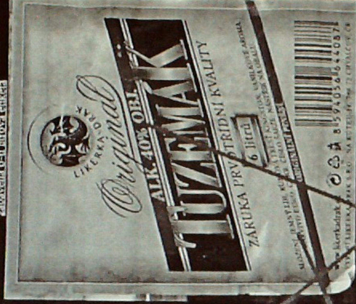
zabavená 6-ti litrová etiketa